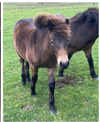
"Vanja" 467/22 in GER Linie 54/7 Kings Pixie

2023 geborene Stutfohlen aus den unterschiedlich bedrohten Linien