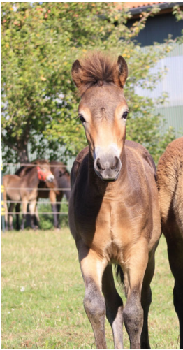
„Commonoaks Cara“ 551/5 in GER Linie 48/29 Willows

20 von den 80 Stutfohlen gehören zu den genannten Linien, also 25% - im Schnitt gehört also jedes vierte Fohlen mittlerweile einer bedrohten Linie an (zum Vergleich – letztes Jahr waren es 21%) – das ist eine sehr erfreuliche Entwicklung!