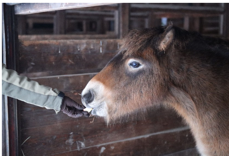
“Sabas Sorcha” 324/60 in GER Linie oA/51 (Milkbar)